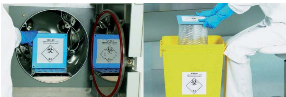
Abb. 5: HEPA-Patronenfilter passen in kleine Autoklaven und übliche Abfallentsorgungsbehälter.

Viele Servicetätigkeiten, wie etwa der Austausch eines Ventilators oder Filters in Bereichen hinter der Hauptfilterstufe (s. Abb. 1), können erheblich sicherer, schneller und kostengünstiger