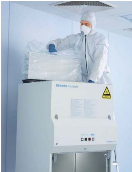
Abb. 3: Kontaminationsarme „Sack-Wechsel-Technik“ (Bag-Out-System).