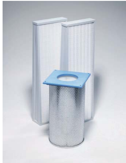
Abb. 4: Herkömmliche Keilfilter im Vergleich zu innovativen Patronenfilter aus HEPA-Hauptfilterstufen.

Schutz- resp. Sicherheitsstufe 3 und 4 immens, insbesondere bei Tätigkeiten mit hohem oder sehr hohem Gefährdungspotential.