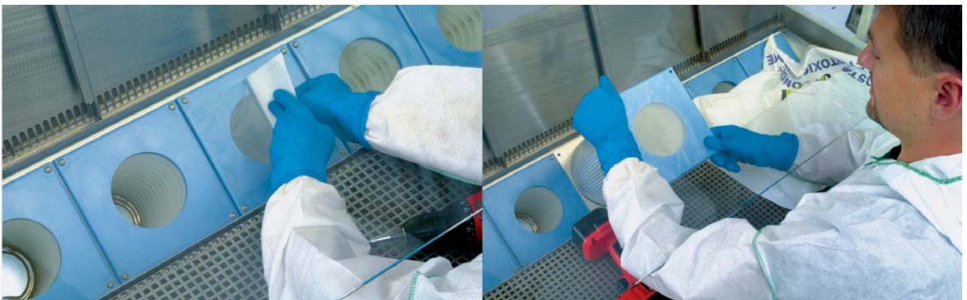
▼ Abb. 2: Aerosoldichtes Versiegeln und kontaminationsarmer Wechsel eines HEPA-Patronenfilters.