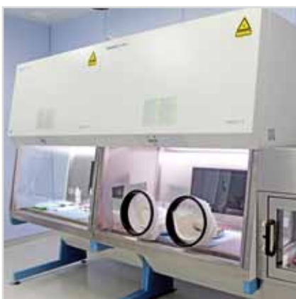
3 Systembeispiel Sicherheitswerkbank und Zytostatika-Isolator.

Das für gewöhnlich feste Gehäuse ist eine wesentliche sicherheitstechnische Komponente, welchem eine hohe Bedeutung bezüglich der Barrierefunktion zukommt. Die so genannte Leckagesicherheit des Gehäuses muss mittels einer