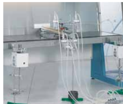
2 Teststand mikrobiologische Prüfung Personenschutz gemäß DIN EN 12469.

Ein kontaminationsarmer Filterwechsel ist definiert als eine segmentierte HEPA-